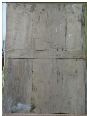
Рис. 4. Зворот ікони