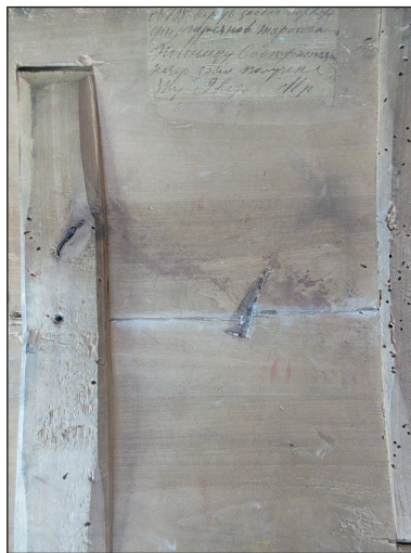
Рис. 11. Наклейка на звороті ікони

Таким чином, доведено, що ця ікона не є автентичною, є сучасною підробкою і не має мистецької цінності.