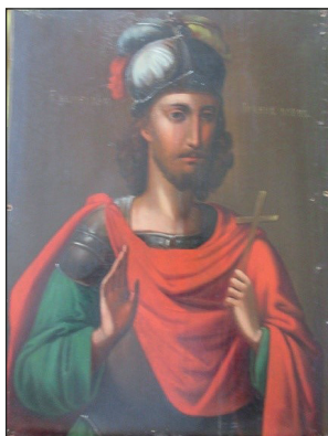
Рис. 3. Ікона «Св. великомученик Іоанн Воїн»

За такою самою схемою досліджувалась ікона «Св. великомученик Іоанн Воїн» (рис. 3, 4).