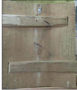
Рис. 8. Зворот ікони

Розмір ікони 40,3 x 35,2 x 3 см, вона написана на основі з деревини липи, з двома зустрічними врізними шпугами з берези, в техніці паволока, левкас, сусальна позолота, темпера, цировка, гравіювання по левкасу. Стан ікони оцінений як задовільний. Зафіксовано зафарбування торців ікони і додаткове закріплення основи по торцях скобами з сучасних металевих цвяхів.