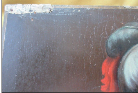
Рис. 5. Фрагмент ікони з імітованим осіданням лаку

Ікона була датована початком ХХ століття, написана на липовій дошці з однією врізною наскрізною березовою шпугою в техніці олійного живопису. Її розміри: 41,7 x 31,4 x 1,8 см. Поверхня живопису вкрита щільним шаром пилу і забрудненнями у вигляді плям, у тому числі й пліснявою. В шарі покривного лаку зафіксовано ознаки імітованого старіння, зокрема, зморщування і зсідання (рис. 5).