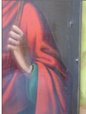
Рис. 6. Імітація залишків оправи

Зафіксовано по периметру лицьової поверхні ікони несистемно набиті сучасні цвяхи із двома дрібними шматочками фольги з мідного сплаву, які імітують залишки оправи (рис. 6).