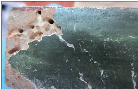
Рис 9. Імітація пошкодження деревогризом

Під час огляду було зафіксовано на боках основи, торцях і на лицьовій площині ікони численні штучно зроблені отвори, імітуючі проїдені ходи від ураження деревогризами (рис. 9). Ретельне дослідження цих отворів довело відсутність деревного порошку вглибині, а «уражені» ділянки мають непошкоджену структуру деревини. Про штучну імітацію ураження поверхні свідчить імітоване реставраційне мастикування ходів деревогризів (рис. 9).