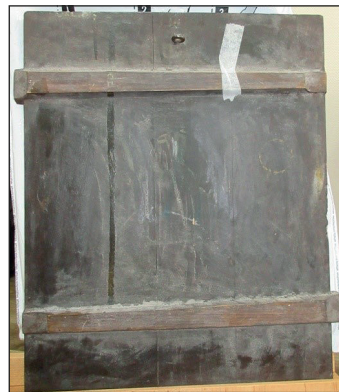
Рис. 2. Зворот ікони

Обстеженням ікони встановлено, що її розмір становить 51 x 41 x 3 см, живопис виконаний олійними фарбами по левкасу із паволокою на основі з трьох березових дошок, з'єднаних вертикально і скіплених двома