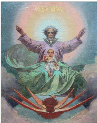
Рис. 1. Ікона «Отечество»

Першим дослідженим твором мистецтва є ікона «Отечество» (рис. 1, 2).