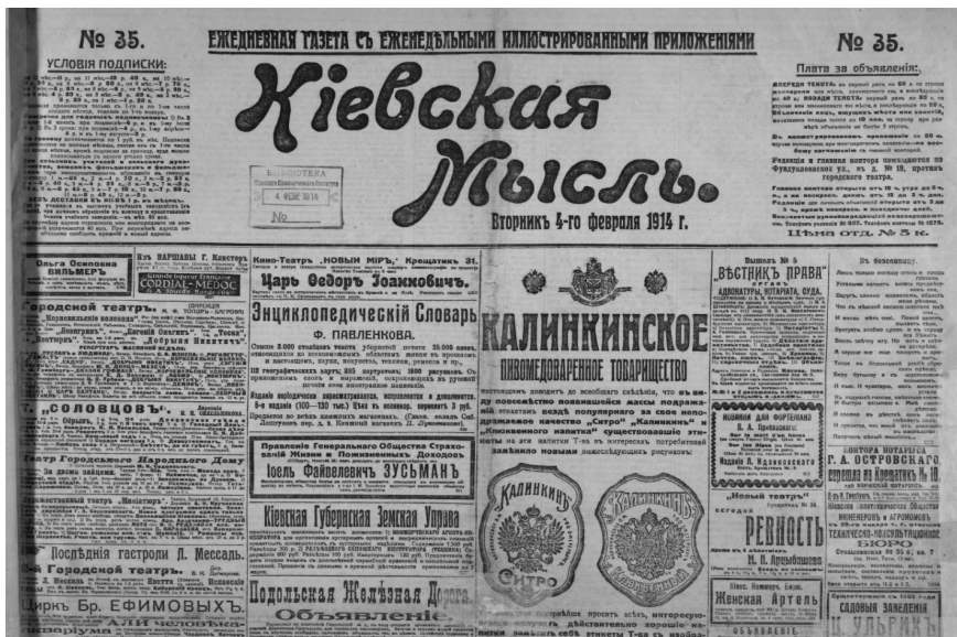
Рис. 1. Титульна сторінка газети «Киевская Мысль» від 4 лютого 1914 року

Однією з найпопулярніших була щоденна громадсько-політична й літературна газета буржуазно-демократичного спрямування «Киевская мысль». Видання друкувало матеріали представників Конституційно-демократичної партії, партії меншовиків і більшовиків, а також письменників-демократів. Газета поширювалася на території Правобережної України [3]. У номері від 4 лютого 1914 року повідомлялось про урочисте відкриття Кабінету: «Министр юстиции И.Г. Щегловитов утром, 2 февраля, с сопровождающими его чинами, присутствовал на богослужении в Софиевском соборе. Затем был в одной из фотографий, где снимался. В час дня, в присутствии г. министра юстиции состоялась в судебной палате торжество освящения и открытия кабинета научно-судебной экспертизы. После торжества в судебной палате И. Г. Щегловитов посетил Киево-Михайловский монастырь, где прикладывался к святыням монастыря» (рис. 1).