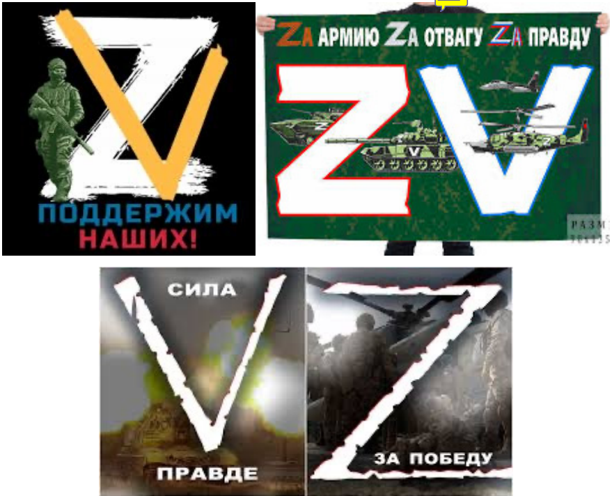
Рис. 1-4. Зображення латинських літер «Z», «V» в соціальних мережах

Приклади таких зображень наведені на рис. 1-5.