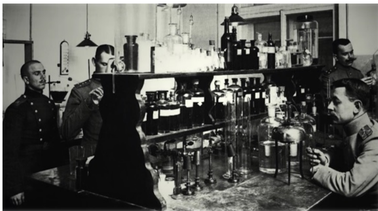
Рис. 2. Апарат для метричної фотографії системи Бертільйона

Структура Київського КНСЕ була такою: фотографічний відділ, кримінально-технічний (криміналістичний) відділ, хімічний відділ і канцелярія. Кабінет обладнано новітньою криміналістичною технікою.