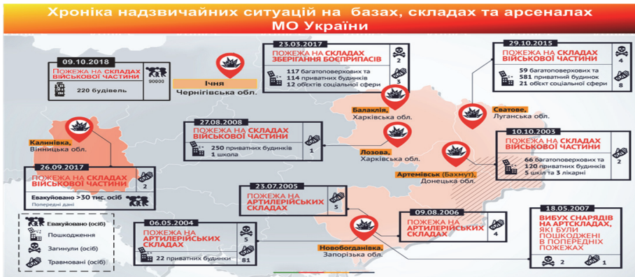
Рис. 1. Хроніка надзвичайних ситуацій на базах, складах та арсеналах Міністерства оборони України

Для приведення сил та засобів технічного забезпечення Збройних Сил України до спроможності реалізації визначених військових цілей за умов ресурсного забезпечення та відповідно до встановлених стандартів НАТО у Київському науково-дослідному інституті судових експертиз проводиться науково-дослідна робота щодо відповідності дій (бездіяльності) посадових осіб вимогам нормативно-правових документів щодо зберігання ракет та боєприпасів.