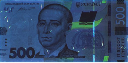
Рис. 5. Лицьовий бік банкноти номіналом 500 гривень зразка 2015 року, на якій відсутня люмінесценція бірюзовим кольором зображень, нанесених способом глибокого друку фарбою синього кольору (зйомка в УФ-променях, \lambda=365 нм)