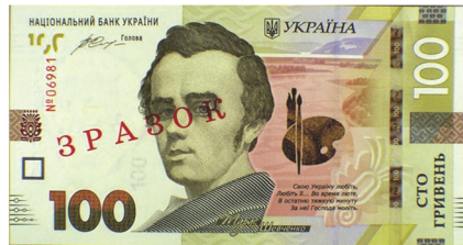
Рис. 8. Загальний вигляд лицьового боку банкноти-зразка номіналом 100 гривень зразка 2014 року

Третю групу складають дефекти, які утворюються під час нанесення на банкноти серійних номерів. До них відносяться відсутність серійних номерів, розташування номерів зі здвигом від встановлених ділянок (Рис. 9), друк номерів на невідповідному боці банкноти, перевернуті номери відносно основних зображень на банкноті.