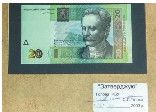
Рис. 1. Підписний аркуш із зображенням лицьового боку банкноти номіналом 20 гривень, затверджений Головою НБУ Сергієм Тігіпко

До початку друкування проводяться підготовчі роботи: розробляється технологічна документація, де відмічені особливості кожного етапу друкування; здійснюється монтаж та приладка друкарських форм. Попередньо, фахівці виробничо-технологічної лабораторії здійснюють підбір фарб за кольорами для відтворення на друкарському відбитку кольорової гами затвердженого кромалінового зразка банкноти. Цехом фарб, згідно розроблених лабораторією рецептур, виготовляються фарби для друкування тиражу. Виготовлений підписний аркуш, після його затвердження Головою Національного банку, слугує еталоном для друкування (Рис. 1).