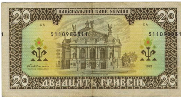
Рис. 9. Зворотний бік банкноти номіналом 20 гривень зразка 1992 року, на якій спостерігається здвиг номерів

Третю групу складають дефекти, які утворюються під час нанесення на банкноти серійних номерів. До них відносяться відсутність серійних номерів, розташування номерів зі здвигом від встановлених ділянок (Рис. 9), друк номерів на невідповідному боці банкноти, перевернуті номери відносно основних зображень на банкноті.