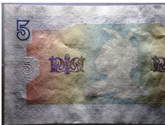
Рис. 3. Збільшений фрагмент лицьового боку цієї банкноти (зйомка у кососпрямованому світлі)