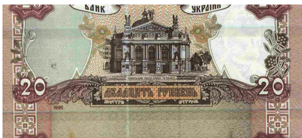
Рис. 10. Зворотний бік банкноти номіналом 20 гривень зразка 1995 року, яка розрізана зі зміщенням від країв по горизонталі

Четверту групу утворюють банкноти, на яких дефекти утворилися на завершальній стадії під час розрізування задрукованих аркушів (Рис. 10).