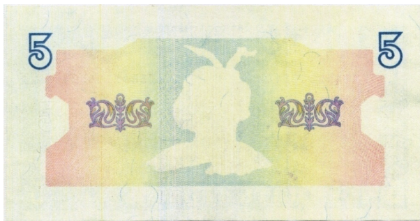
Рис. 2. Загальний вигляд лицьового боку банкноти номіналом 5 гривень зразка 1992 року з дефектом виробника (відсутні офарбовані зображення, що наносилися способом металографського друку фарбою синього кольору)