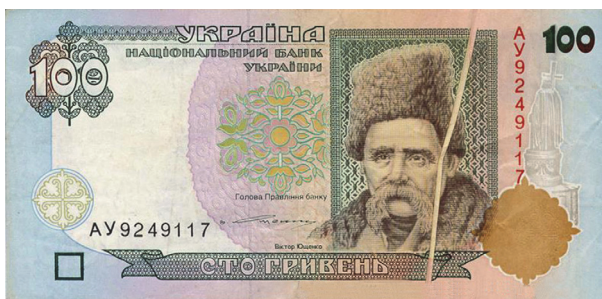
Рис. 4. Загальний вигляд лицьового боку банкноти номіналом 100 гривень зразка 1996 року зі складкою паперу