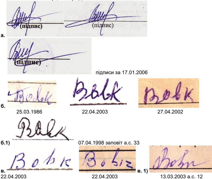
Рис. 3. а – досліджувані підписи; б – вільні зразки 1-а група; б.1. – підпис достовірно виконаний від імені особи підписи від імені якої досліджуються; в – вільні зразки 2-а група; в. 1. – підпис достовірно виконаний родичем особи від імені якої досліджуються підписи

Лише під час детального вивчення матеріалів справи було встановлено підпис (див.: рисунок 3) (б.1.) в документі на ім'я особи від імені якої досліджуються підписи та підпис (в.1.) в документі на ім'я рідного сина. Що виключає можливість зробити експертові хибний висновок про використання особою трьох варіантів підписів. В підтвердження висновку про те, що досліджувані підписи виконані не від імені особи яка ідентифікується, а іншою особою без наслідування письмово рухової навички останньої. Окрім того виробленість досліджуваних підписів значно вища за якість виконання ніж зразки 1-ї та 2-ї групи підписів які надані в якості порівняльних зразків. Як відомо, покращити виробленість письмово рухових навичок, що сформувалися у дорослої людини на протязі десятиліть її життя в значній мірі, не представляється можливим.