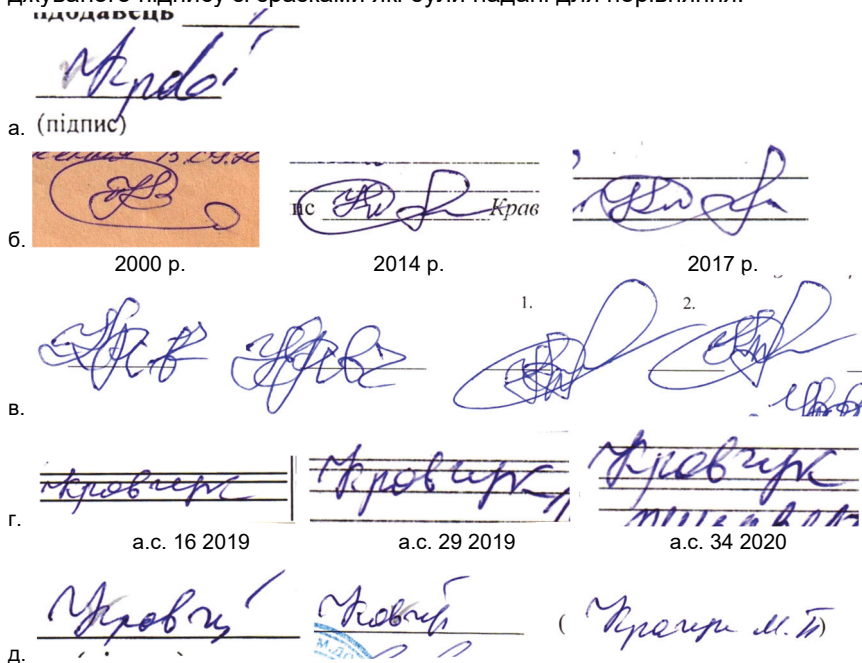
Рис. 4. а – досліджуваний підпис за 2014 р.; б – вільні зразки підписів; в – експериментальні зразки підписів; г – умовно-вільні зразки підписів з матеріалів справи; д – підписи в додатках до досліджуваного документу

З матеріалами справи надійшов досліджуваний документ, згідно Рекомендацій надано вільні та експериментальні зразки підписів особи яка ідентифікується (див.: рисунок 4). Одразу впадає в око розбіжність досліджуваного підпису зі зразками які були надані для порівняння.