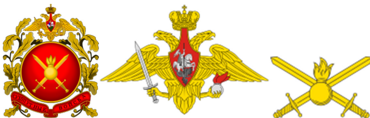
Рис. 7. Зображення символіки сухопутних військ рф

Приклади таких зображень наведені на рис. 7-10.