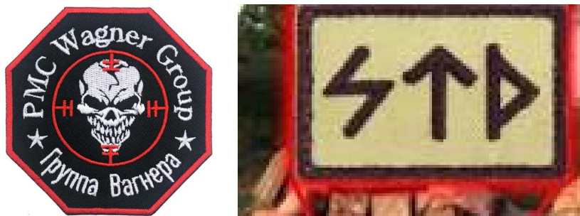
Рис. 10. Зображення символіки «ЧВК Вагнера» (Приватна військова компанія «Вагнер»), що належить до збройних формувань рф

Як відомо, об'єктами досліджень у судових мистецтвознавчих експертизах є як самі символи, наприклад, пам'ятники, прапори, нагороди, так і зображення символів на різноманітних носіях та основах – на листівках, у газетах і книгах, у рекламі, на одязі, на предметах побуту чи сувенірній продукції, на ювелірних прикрасах, на прапорах, штандартах, транспарантах, вимпелах, на стінах споруд, на транспортних засобах, на цифрових носіях інформації і т.п.