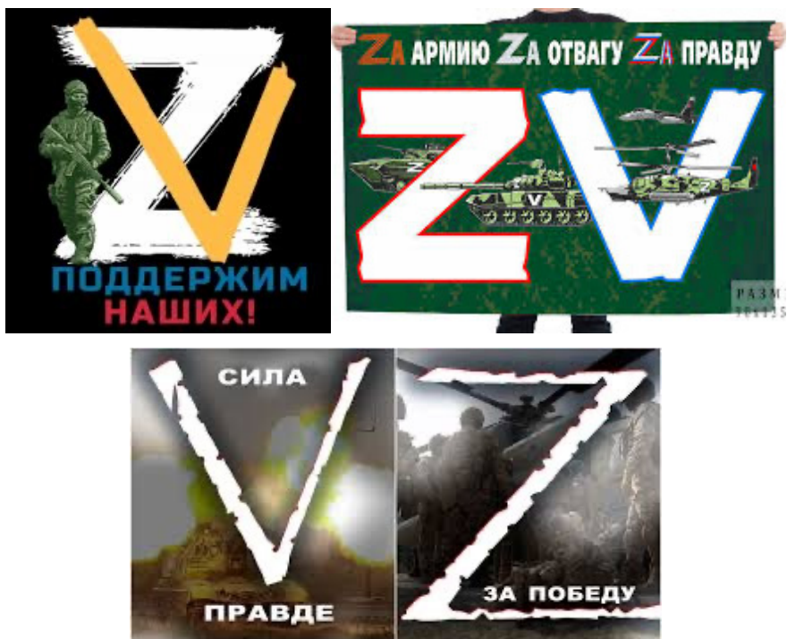
Рис. 1-4. Зображення латинських літер «Z», «V» в соціальних мережах

Приклади таких зображень наведені на рис. 1-6.