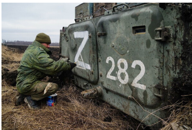
Рис. 5. Зображення латинської літери «Z» на військовій техніці