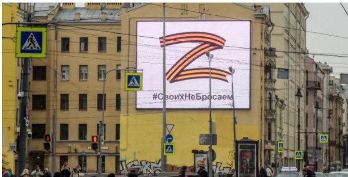
Рис. 6. Зображення латинської літери «Z» на банері

б) зображення або сама символіка збройних сил російської федерації, у тому числі її сухопутних військ, повітряно-космічних сил, військово-морського флоту, ракетних сил стратегічного призначення, повітряно-десантних військ, сил спеціальних операцій, інших збройних формувань та (або) органів держави-терориста (держави-агресора) [17].